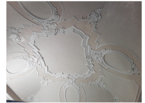
Restauro Palazzo Senatore Capistrano (AQ), 2015