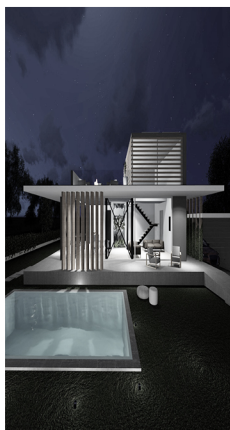
Lottizzazione Via Kindù Fabriano (AN), in corso