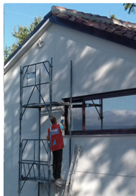
Casa Mezzopera Fabriano (AN), 2019