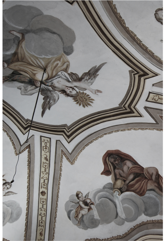
Restauro Palazzo Cerbelli Fabriano (AN), 2013