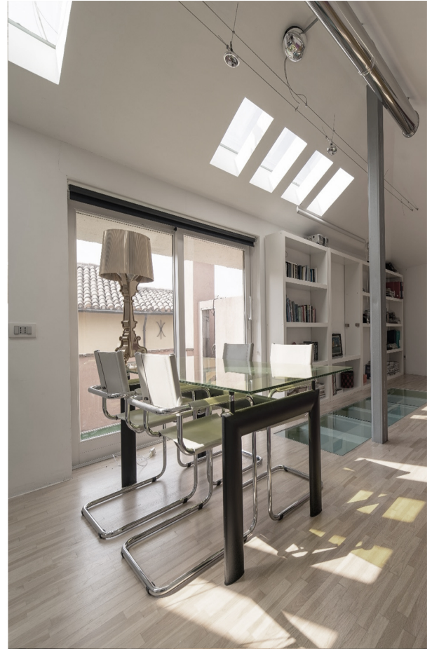
Piazza dei Partigiani Fabiano (AN), 2013