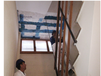
Condominio Mdl 50 Fabriano (AN), 2018