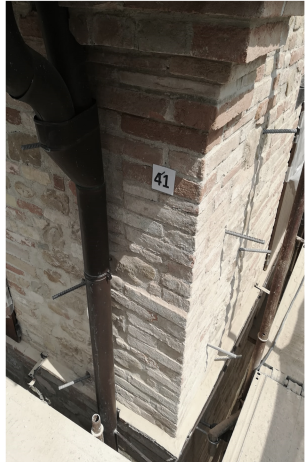
Podere Cacciamani Treia (MC), 2018