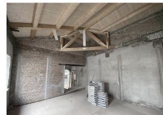
Villa Ottoni Fabriano (AN), 2020