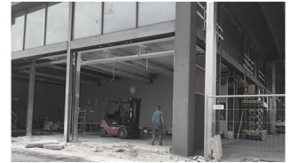
Concessionaria Tesla Padova (PD), 2017