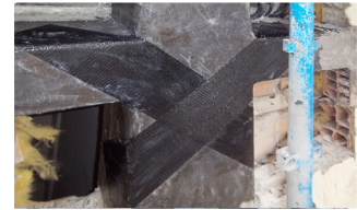
Condominio Eugenia Luculi (AQ) , 2017