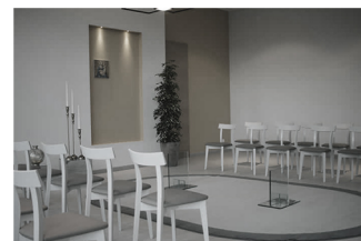
Infinitum Casa del commiato Fabriano (AN), 2018