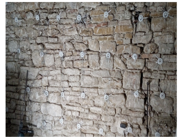
Casa Gentili Camerino (MC), 2017