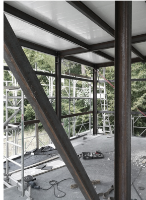
Casa di Risposo Beato Sante Mombarroccio (PU), 2016