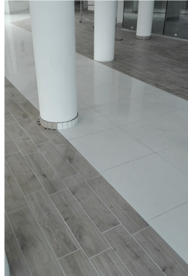
Reale Mutua Agenzia Assicurativa Fabriano (AN), 2018