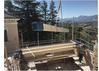
Palazzo Purarello Gagliole (MC), 2020